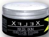
HAIR GUM CREATIVE STRONG EXTREME HOLD tenuta estrema styling creativi

Extra strong holding gel for creative, defined styling; without alcohol; it dries rapidly without drying out hair, leaves no residue and increases your hair's shininess.