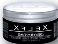
SMASHCUBE GEL EXTREME BREAK STRONG SPLITTED extra forte effetto spaccato